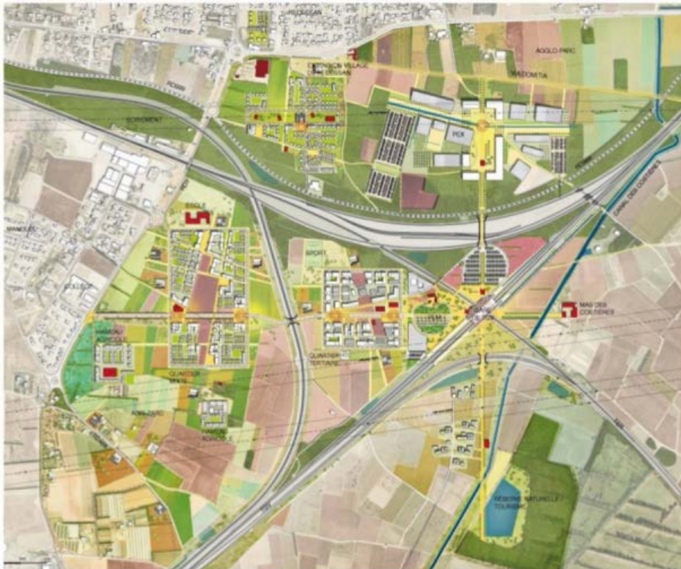
Plan masse (horizon 2040) des architectes Reichen et Robert, lauréats du concours d'aménagement en 2015

« Une réflexion est menée sur un projet de ZAD autour du projet de gare à Manduel. Aujourd'hui le périmètre de ZAD évoqué est de 330 ha, pour partie dans la ZPS. Ce projet sera soumis à des procédures réglementaires dont les études d'incidences.